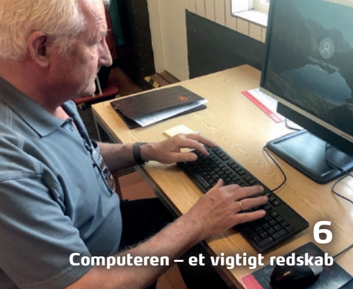
6 Computeren – et vigtigt redskab