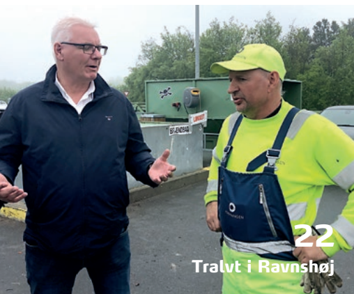
22 Tralvt i Ravnhøj