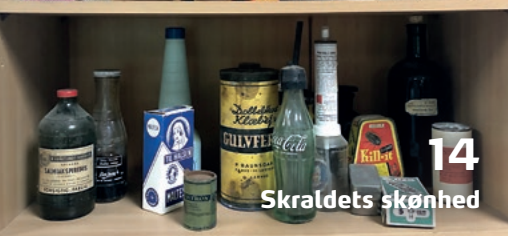
14 Skraldets skønhed